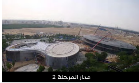
مدار المرحلة 2