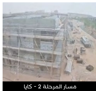
مسار المرحلة 2 - كايا