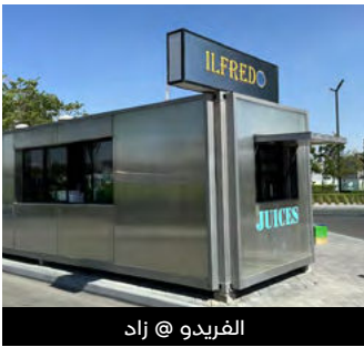
الفريديو @ زاد