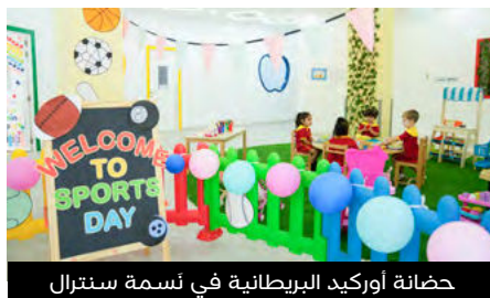
حضانة أوركيد البريطانية في نَسمة سنترال