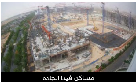
مساكن فيدا الجادة