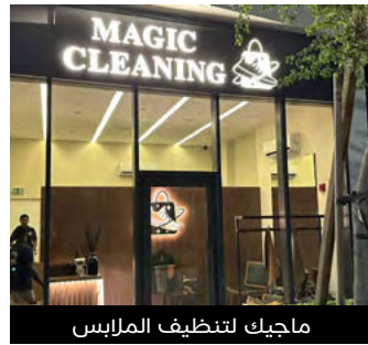
ماجيك لتنظيف الملابس