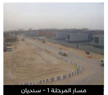
مسار المرحلة 1 - سنديان