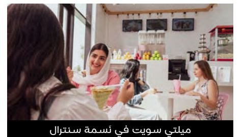
ميلتي سويت في نَسمة سنترال