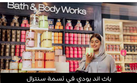
باث اند بودي في نَسمة سنترال

تم تأجير جميع المساحات في نَسمة سنترال، حيث يرحب المجتمع المتكامل بالآلاف المتسوقين والزوار أسبوعياً. تقام سوق منبت للمزارعين الإماراتيين كل يوم جمعة عصراً في نَسمة سنترال.