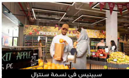
سبينيس في نَسمة سنترال