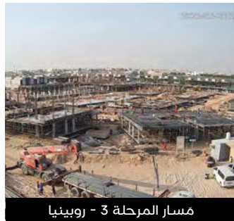
مسار المرحلة 3 - روبينيا