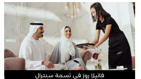
فانيليا روز في نَسمة سنترال