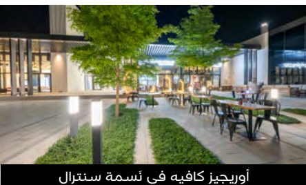
أوريغيز كافيه في نَسمة سنترال