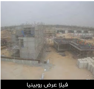
فيلا عرض روبينيا

يستمر تطوير المرافق في مسار سنترال بعد بدء تقديم خدمات ركن زاد لحافلات الطعام في الربع السابق. حيث تم توسعة منطقة ألعاب الأطفال، كما تم الانتهاء من العمل على مرافق مسارات ركوب الدراجات والجري التي تحيط بكامل المجمع السكني.