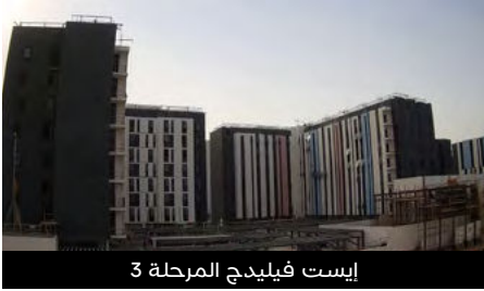
إيست فيليدج المرحلة 3