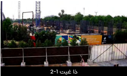
ذا غيت 2-1