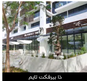
ذا بيرفيكت تايم