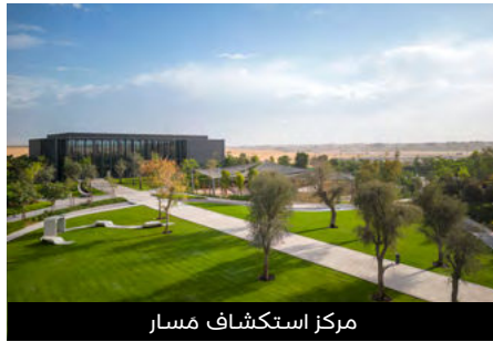
مركز استكشاف مسار