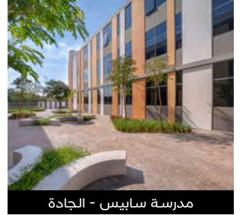
مدرسة سايبس - الجادة